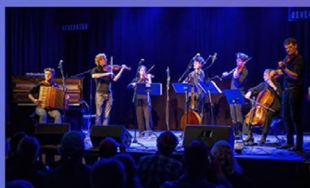
DREAMERS CIRCUS FEAT. NOVO QUARTET PÅ GENERATOR

Interessen for Generators virke har også kunnet ses blandt lokalbefolkningen, hvor vi har over 150 frivillige medhjælpere, samt en god støtte fra det lokale erhvervsliv som giver sponsorater for ca. kr. 800.000 om året. Dette fortæller at en stor del af befolkningen er villige til at investere tid og penge i at have et lokalt spillested, og at kunne fortælle til omverdenen at der er et rigt kulturliv i Vestjylland. Og ved at danne netværk med forskellige samarbejdspartnere, ser vi at engagementet bliver mere mangfoldigt.