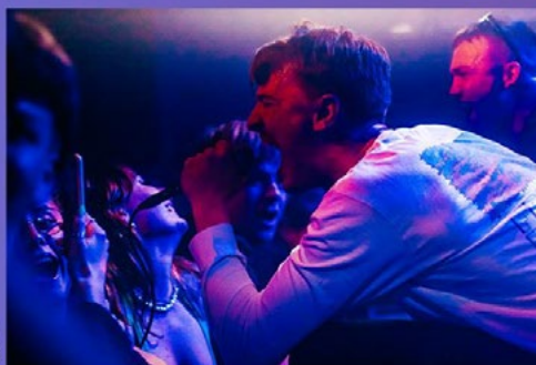
SÅFORSATAN VARMER OP FOR PIND I EN FULD SAL AF UNGE MENSKER PÅ GENERATOR