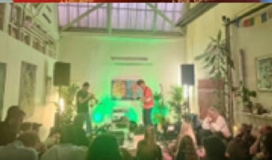
DM I FREESTYLE RAP & PLATFORM K PRÆSENTERER